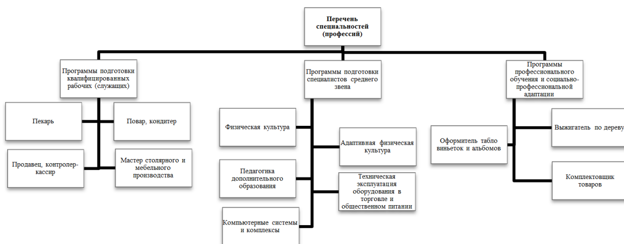
Перечень специальностей (профессий)