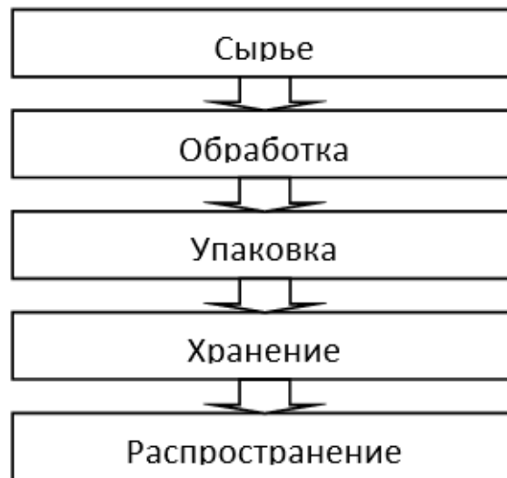
Рисунок 1 – Образец блок-схемы