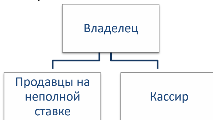
Структура простой организации

Необходимость нанимать работников возникает по самым разным причинам. В случае магазина, структура которого показана на рисунке, какие причины могли быть для найма двух продавцов на неполную ставку и кассира? Назовите три возможные причины, а затем постарайтесь обосновать, почему их не нужно нанимать.