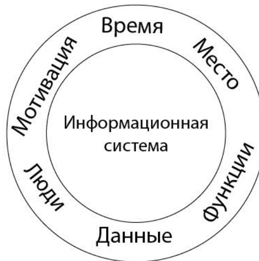
Рисунок 3 – Свертка модели Захмана