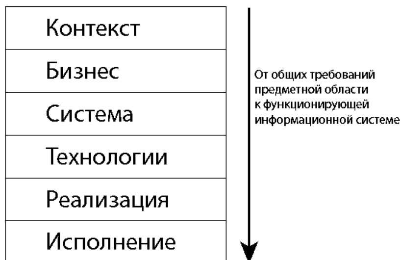
Рисунок 4 – Уровни детализации требований к информационной системе в рамках модели Захмана