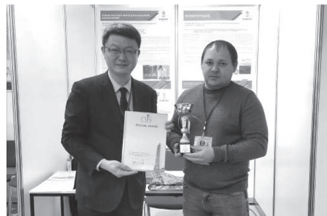
Все представленные разработки наших учёных получили награды

Новый препарат позволит увеличить рост производства экологически чистой продукции в молочном и мясном животноводстве Краснодарского края и России.