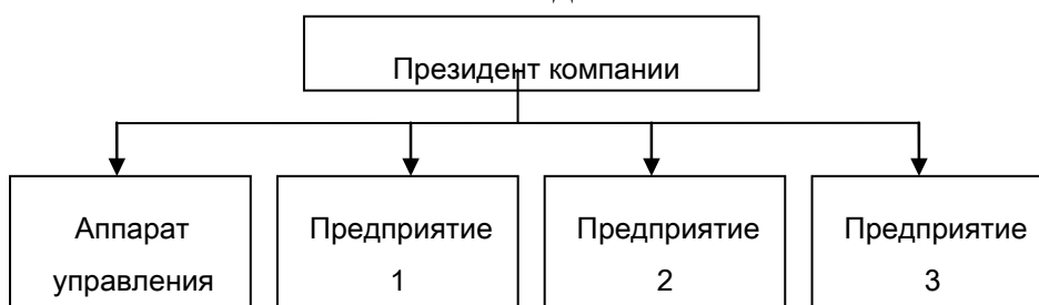
Рисунок 2 - Организационная структура после изменения

В связи с этим структура управления значительно изменилась (рис. 2). Число непосредственно подчиненных у президента компании сильно выросло. Поэтому он уже не мог уделять достаточно внимания корпоративному аппарату управления и всем предприятиям. В результате существенно ухудшились экономические показатели деятельности компании.