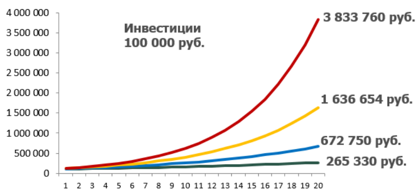
Рисунок 2 – Инвестирование при различных ставках сложных процентов

Сложный процент – эффективный инструмент по увеличению вложенных денег на длительном промежутке времени. Как работают сложные проценты при разных доходностях показано на рисунке 2.