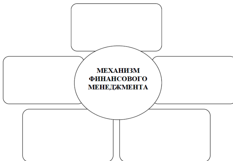
Рисунок – Состав основных элементов механизма финансового менеджмента

Задание 4. Укажите основные элементы механизма финансового менеджмента и заполните схему на рисунке.