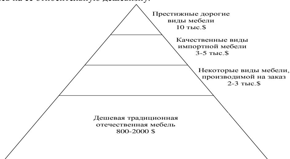
Рисунок 1 – Пирамидальное представление рынка мебели в России