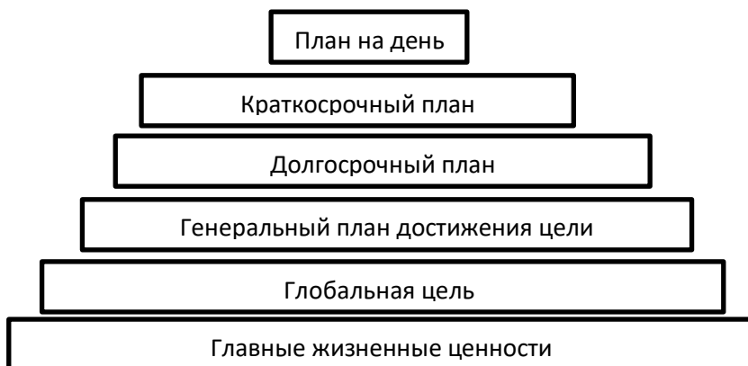
Рисунок – Система Б. Франклина

Система управления временем Бенджамина Франклина основана на базовых принципах классической системы управления временем, которые предусматривают, что любая глобальная задача, стоящая перед человеком, делится на подзадачи, а те в свою очередь – на еще более мелкие подзадачи. Визуально данный процесс можно представить в виде многоступенчатой пирамиды, а применение системы – как процесс поэтапного возведения этой пирамиды.