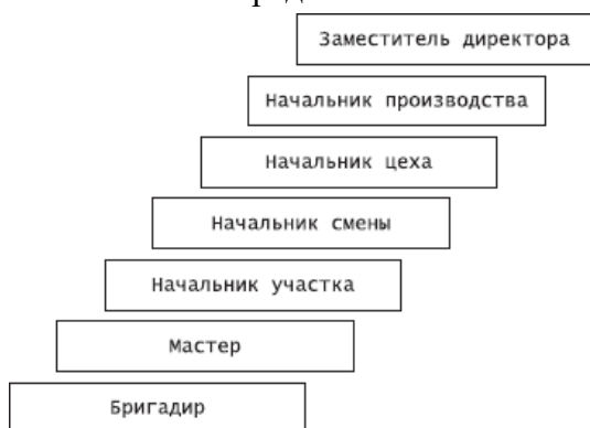
Рисунок 1. Карьера менеджера: вариант А