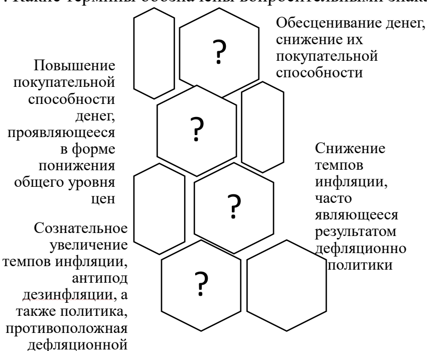
Рисунок – Основные категории, связанные с процессом обесценения денег