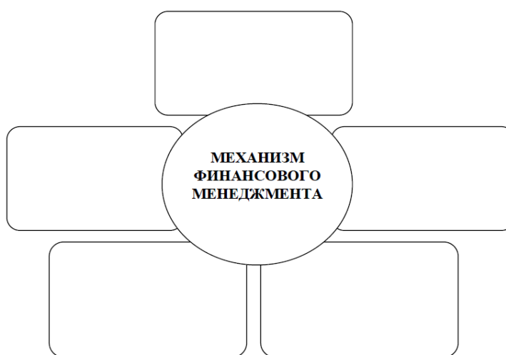
Рисунок – Состав основных элементов механизма финансового менеджмента

Задание 1. Укажите основные элементы механизма финансового менеджмента и заполните схему на рисунке.