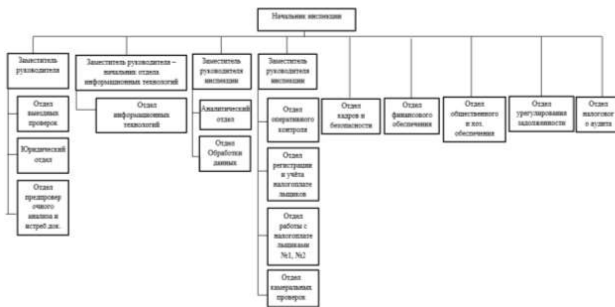
Рисунок 1 – Организационная структура №1

Задание 1. Используя предложенные модели организационных структур, провести их оценку с использованием подхода, основанного на теории информационного поля. По итогам оценки осуществить выбор структуры, имеющей лучшие оценки.