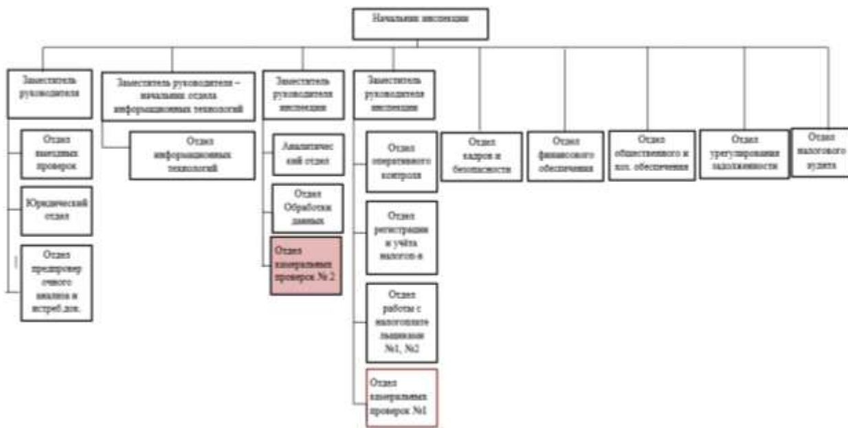
Рисунок 2 – Организационная структура №2