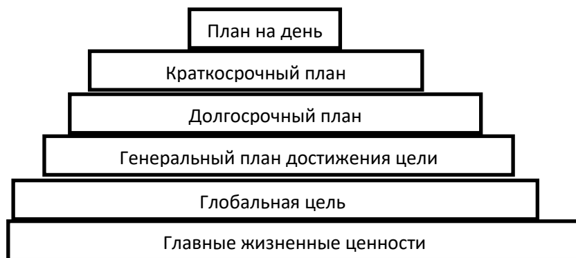
Рисунок – Система Б. Франклина

Система управления временем Бенджамина Франклина основана на базовых принципах классической системы управления временем, которые предусматривают, что любая глобальная задача, стоящая перед человеком, делится на подзадачи, а те в свою очередь – на еще более мелкие подзадачи. Визуально данный процесс можно представить в виде многоступенчатой пирамиды, а применение системы – как процесс поэтапного возведения этой пирамиды.