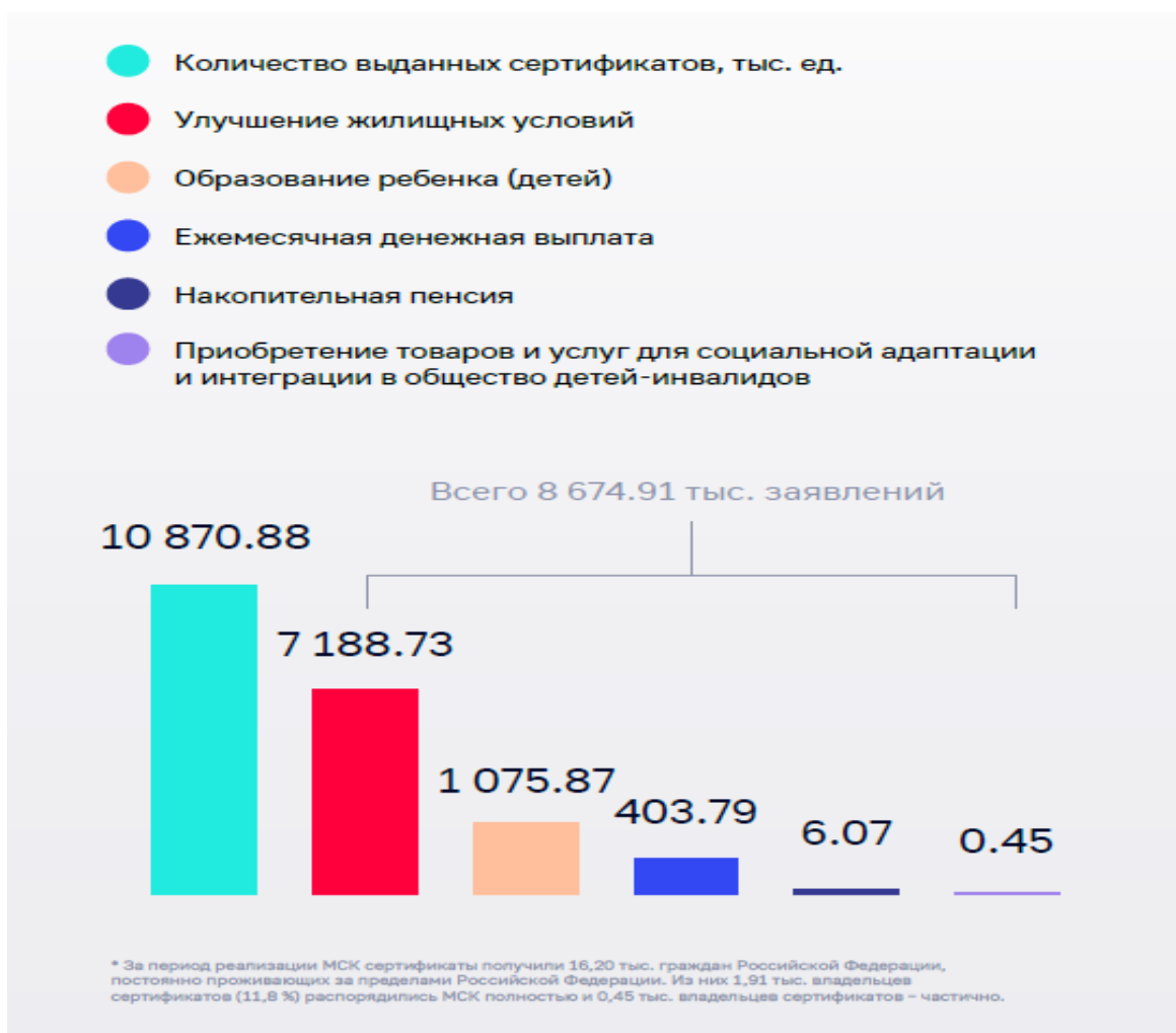
Рисунок 2 – Итоги реализации ФЗ № 256 за 2007-2020 гг.