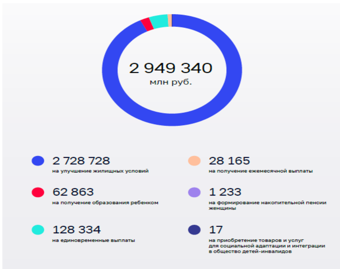
Рисунок 3 – Расходы по направлениям МСК за 2007-2020 гг., млн руб