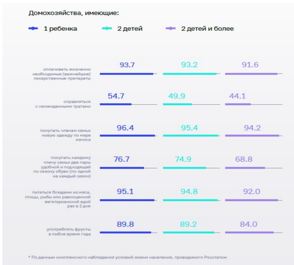
Рисунок 5 – Финансовые возможности домохозяйств с детьми в 2020 году