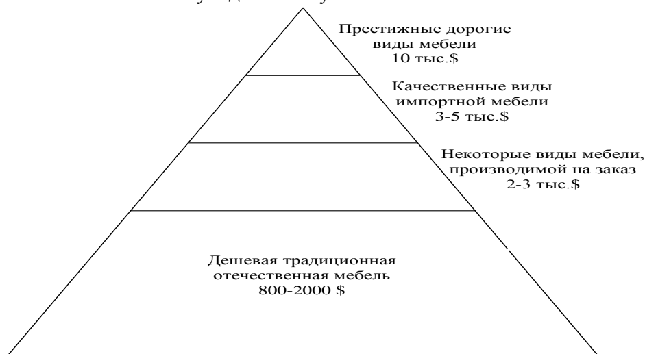
Рисунок 1 – Пирамидальное представление рынка мебели в России

При этом более половины всех покупателей мебели предпочитают приобретать не гарнитуры целиком, а комплектовать набор по своему вкусу и в соответствии с площадью помещений.