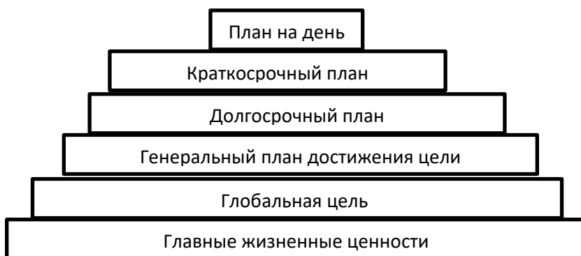
Рисунок – Система Б. Франклина

Задание 5. Система управления временем Бенджамина Франклина основана на базовых принципах классической системы управления временем, которые предусматривают, что любая глобальная задача, стоящая перед человеком, делится на подзадачи, а те в свою очередь – на еще более мелкие подзадачи. Визуально данный процесс можно представить в виде многоступенчатой пирамиды, а применение системы – как процесс поэтапного возведения этой пирамиды.