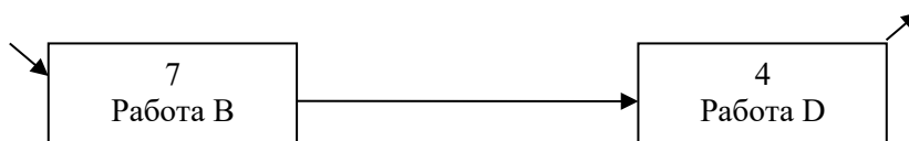
Рис. 1. Сетевая диаграмма проекта

Сократите длительность проекта до 12 дней, с учетом того что вы можете рассчитывать на дополнительное финансирование в размере не более 700 руб.