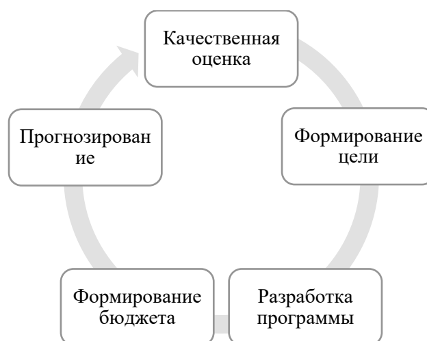
Рисунок 1 – Этапы финансового планирования в страховой компании

9. Обоснуйте целевые ориентиры российского страхового рынка и его институтов