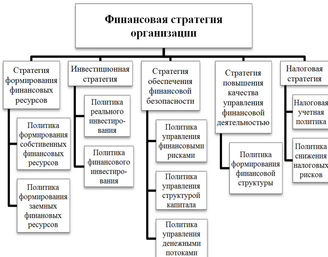
Рисунок – Компоненты финансовой стратегии организации

Задание 7. Опишите, чем, на Ваш взгляд, характеризуется каждый из компонентов финансовой стратегии организации (рисунок).