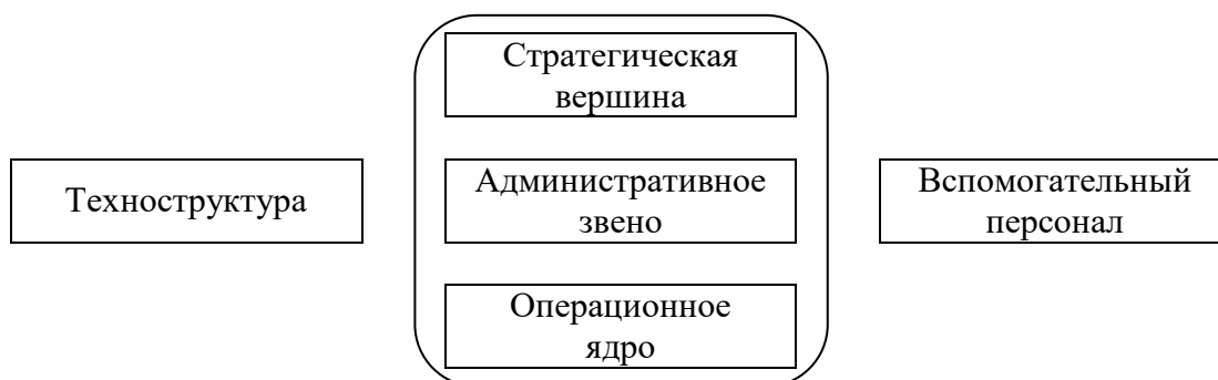
Пять частей организации по Г. Минцбергу

Представьте ВУЗ, в котором Вы обучаетесь, в виде организации по Г. Минцбергу (Г. Минцберг «Структура в кулаке: создание эффективной организации»), выделив пять основных частей. Подумайте, к какому блоку относятся библиотека, столовая, учебное управление и т.д. Обоснуйте свое решение.