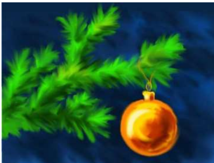
Рисунок 1 – Пример произвольного рисунка